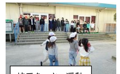
校区あいさつ運動