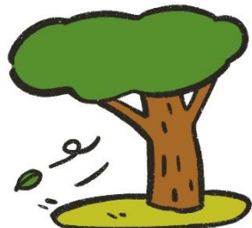
風とおしの良い日影で