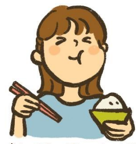
朝・昼・晩の食事