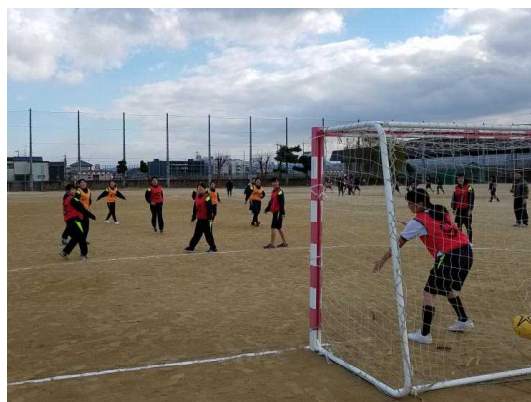
( 2 - 1 ・ 4 体育女子 )