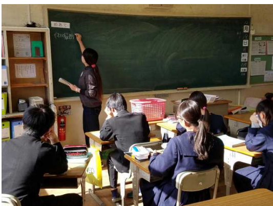
( 3 - 4 英語 ② )