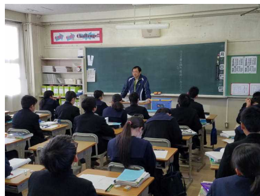
( 2 - 2 国語 )