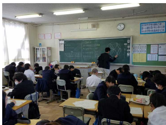
( 1 - 2 数学 )