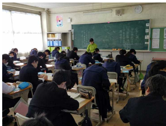
( 3 - 3 国語 )