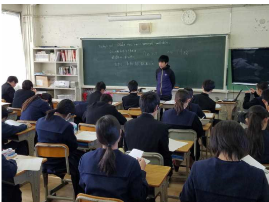
( 2 - 3 英語 )