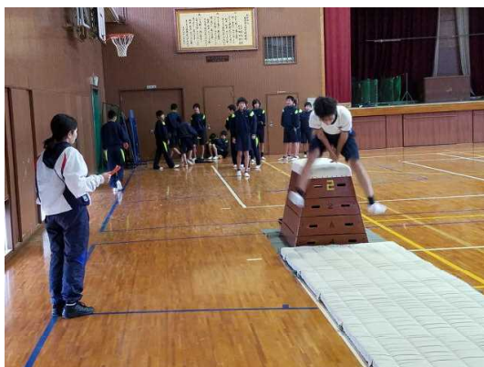
( 2 - 1 ・ 4 体育男子 )