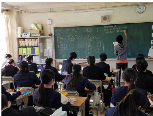
( 3 - 2 数学 )