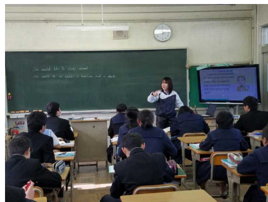
( 3 - 4 英語 ① )