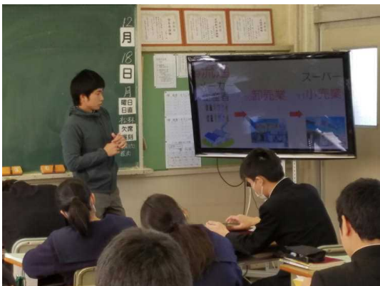
( 3 - 1 社会 )