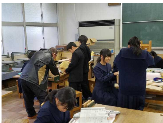
( 1 - 1 技術 )