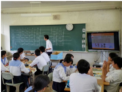
(1組での発表の様子)