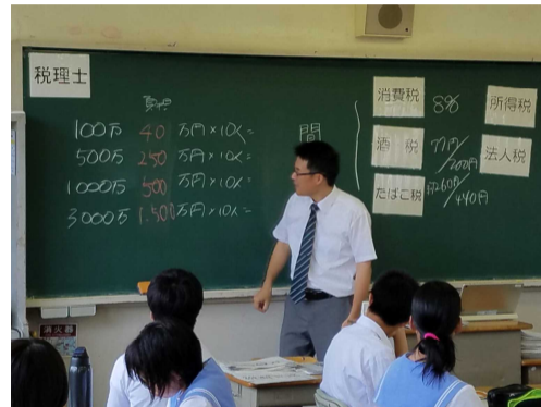
(2組での発表の様子)