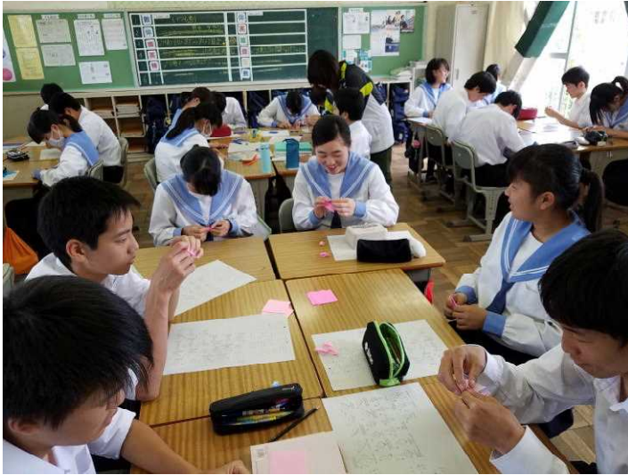
( 1 組 の 様 子 )