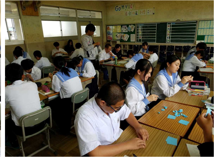
( 3 組 の 様 子 )