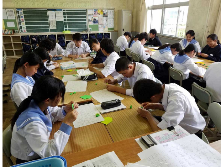
( 2 組 の 様 子 )