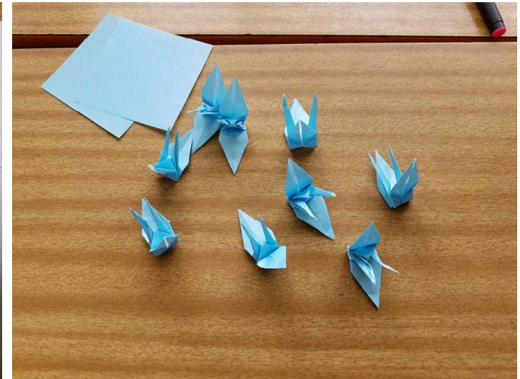
( 3 組 の 鶴 )