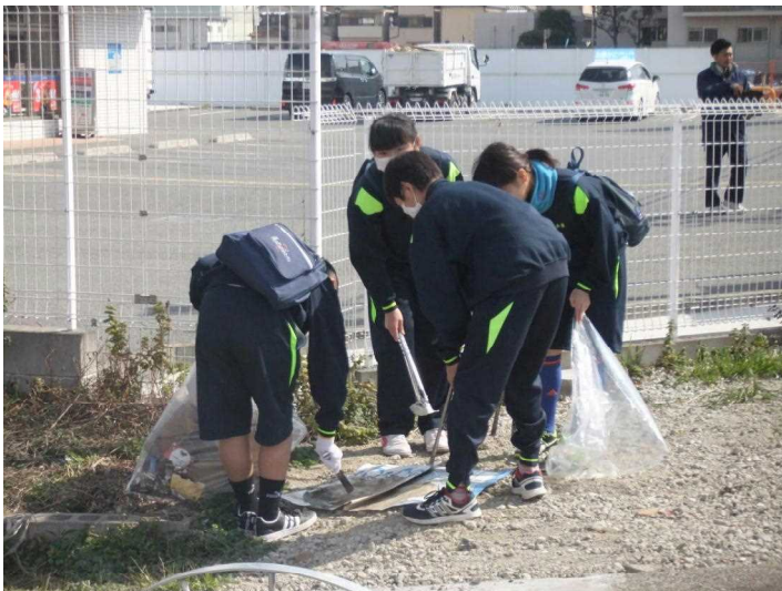
（みんなで頑張った）