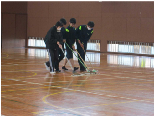
（フロアの拭き掃除）