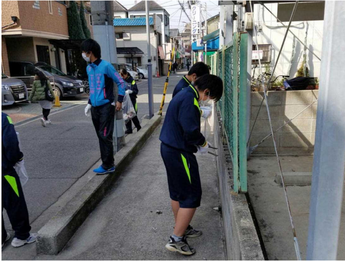
(ブロックの隙間に…)