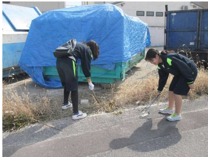
（道ばたのゴミ拾い）