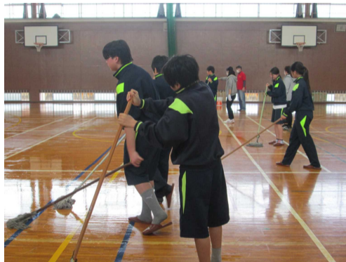
（フロアのワックスがけ）