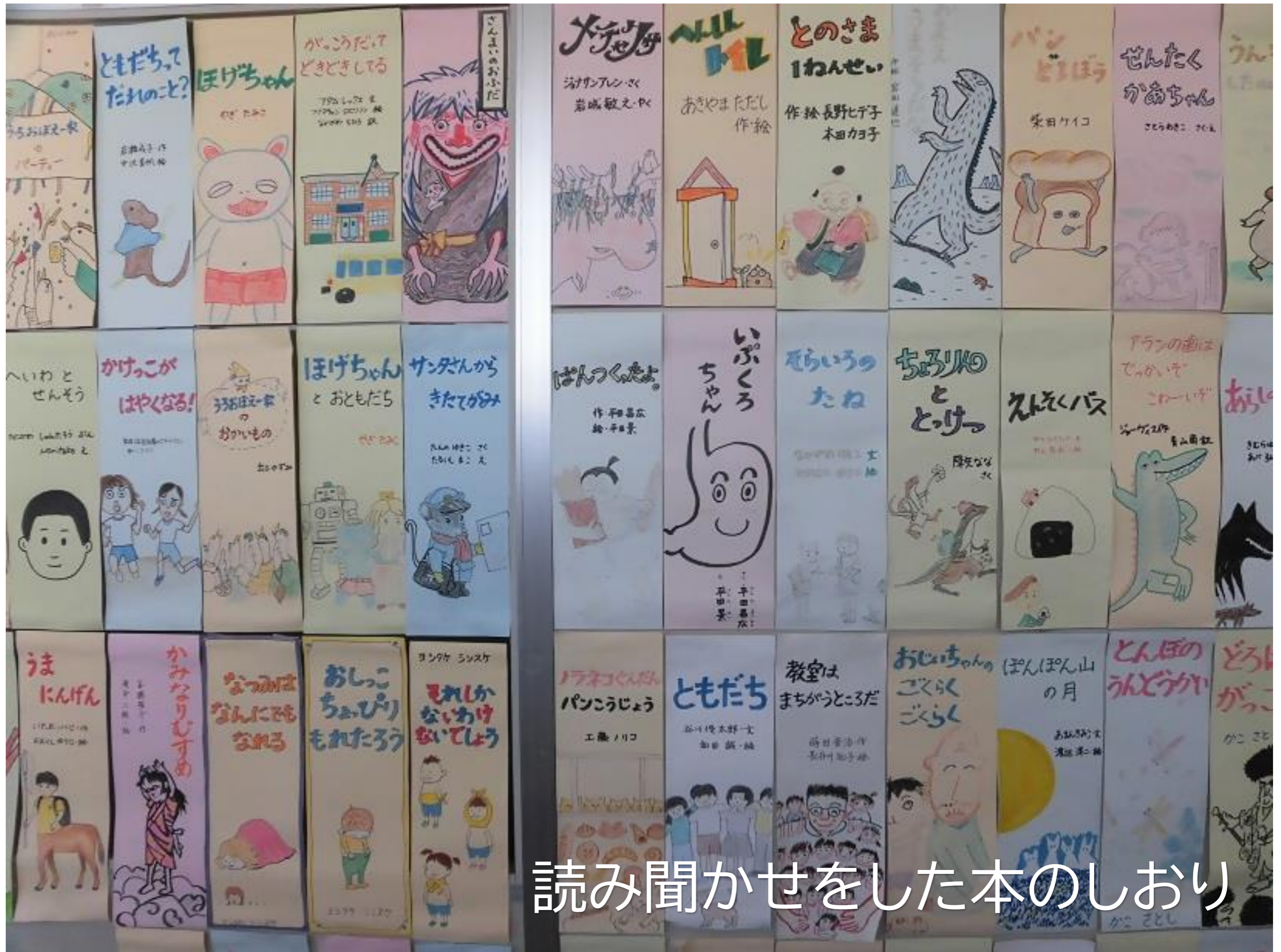
読み聞かせをした本のしおり